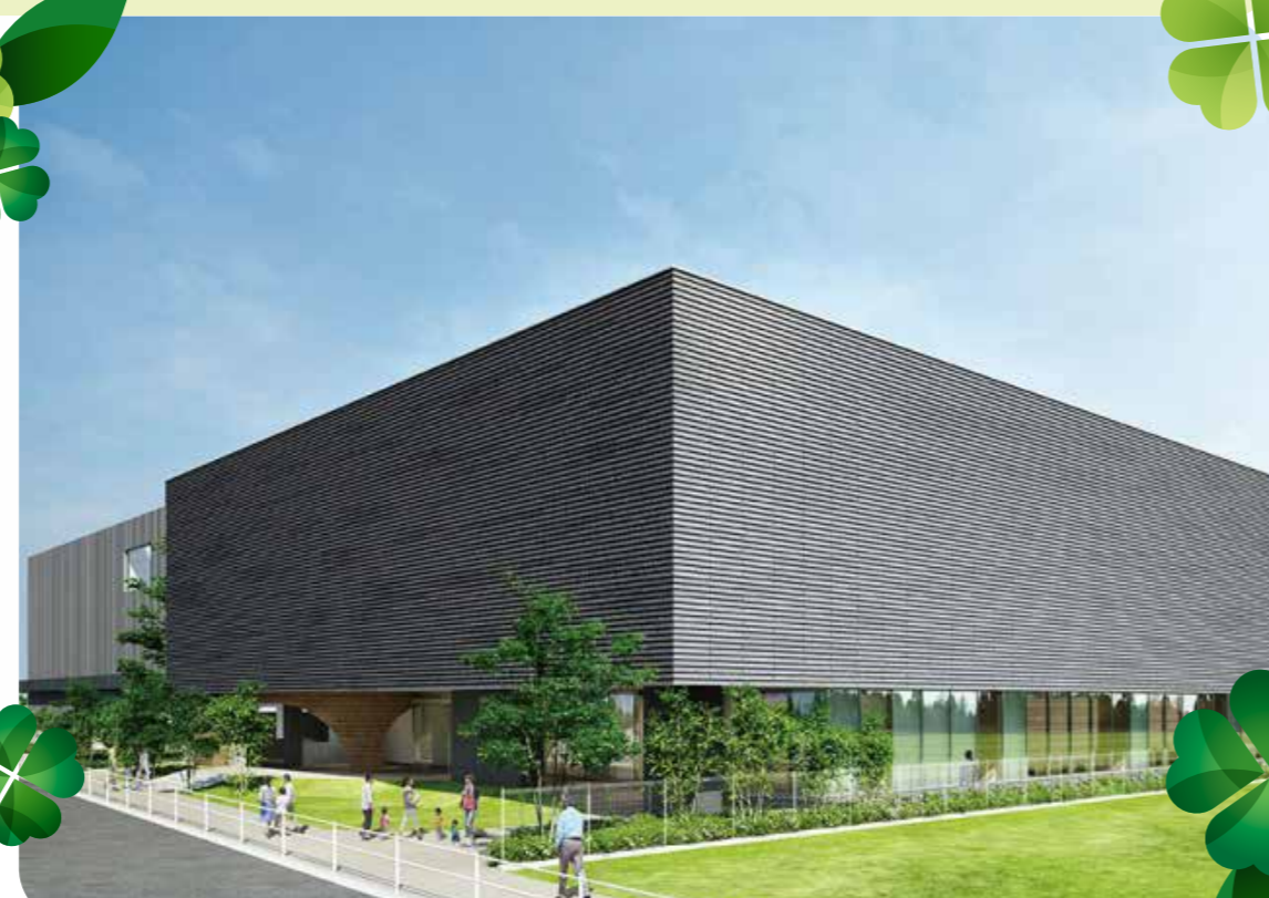
都有施設のZEB化推進