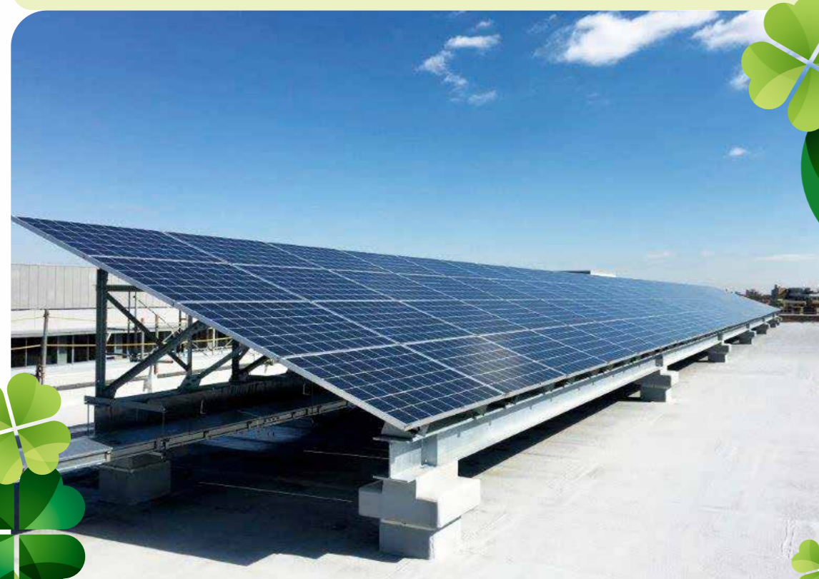
都有施設の改築・改修