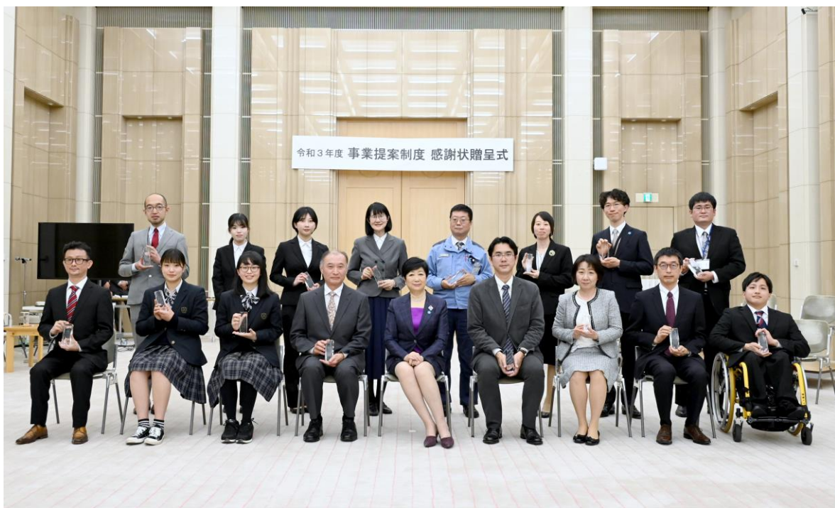
※この写真は、令和3年度に撮影したものです。